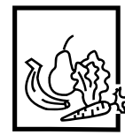
KIT FRUTAS E VEGETAIS