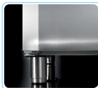
Pés em aço inox ajustáveis em altura (110-190 A mm)